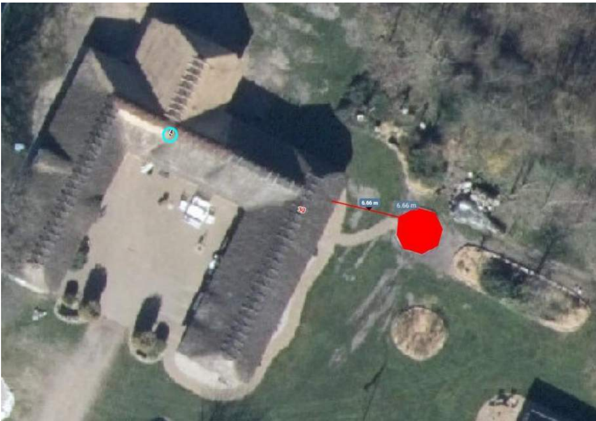
Afstand til eksisterende bolig