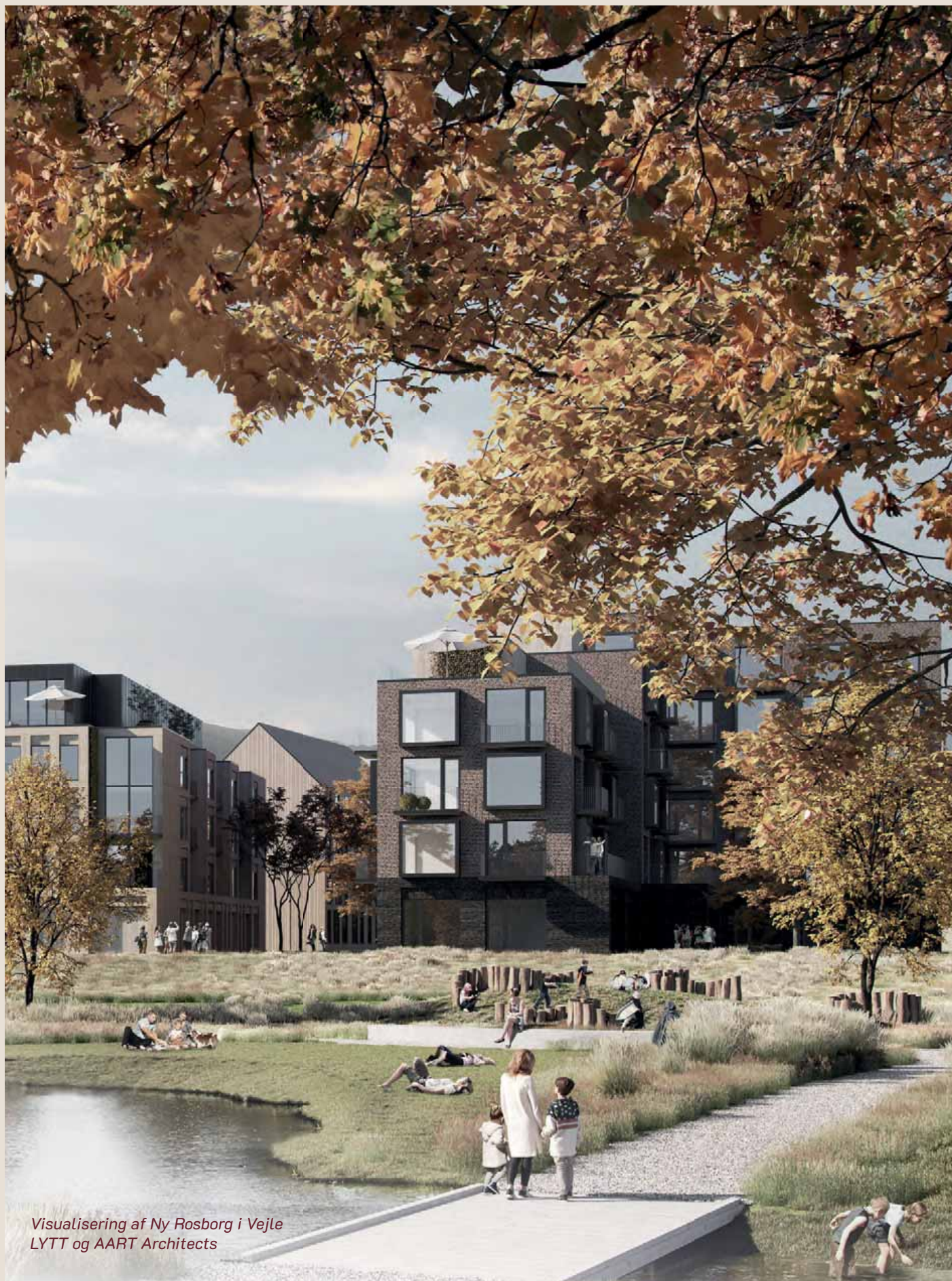
Visualisering af Ny Rosborg i Vejle LYTT og AART Architects