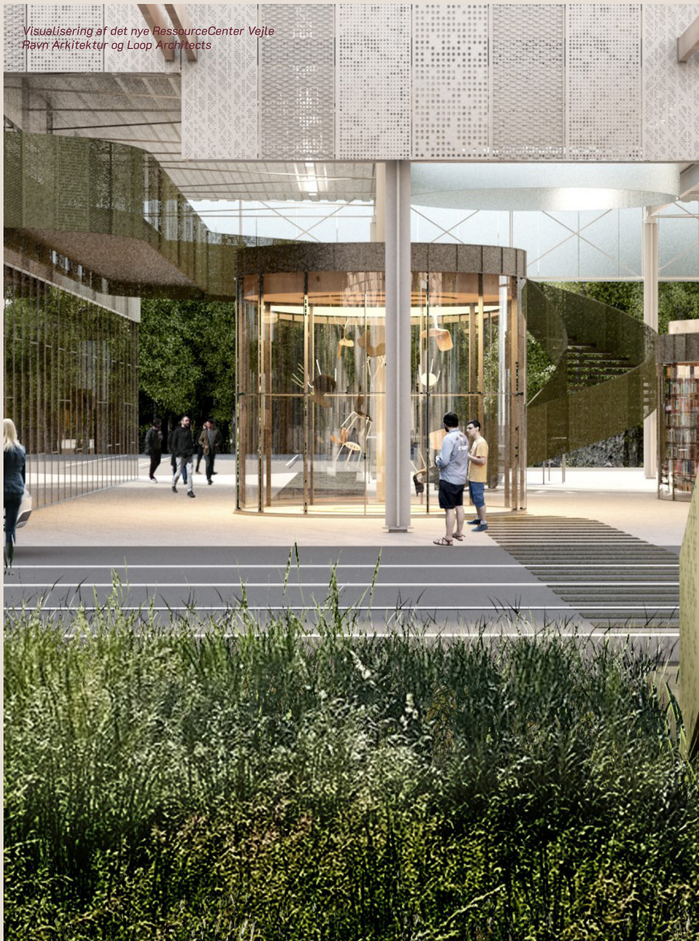
Visualisering af det nye RessourceCenter Vejle Ravn Arkitektur og Loop Architects