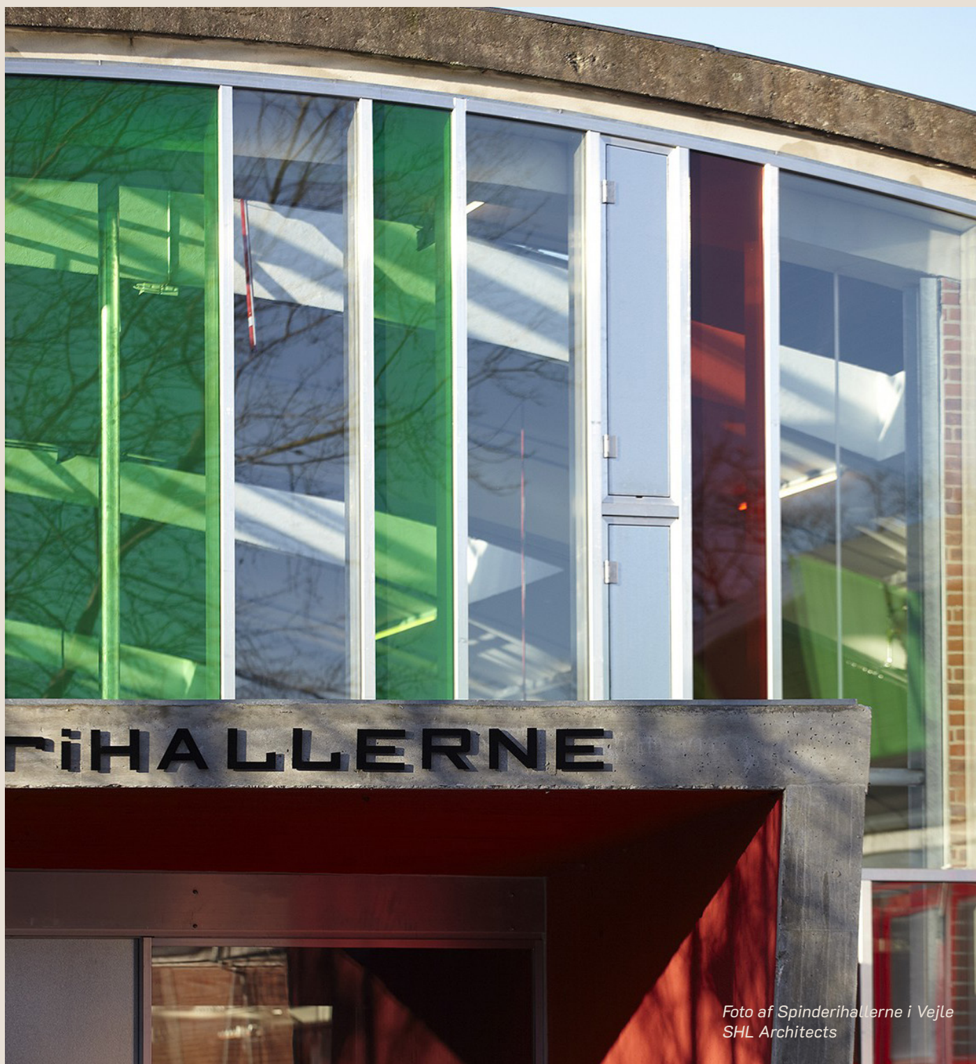
Foto af Spinderihallerne i Vejle SHL Architects

Strategi for bæredygtigt byggeri er udarbejdet i 2021/2022 af Kommunale Ejendomme, Teknik & Miljø, Vejle Kommune