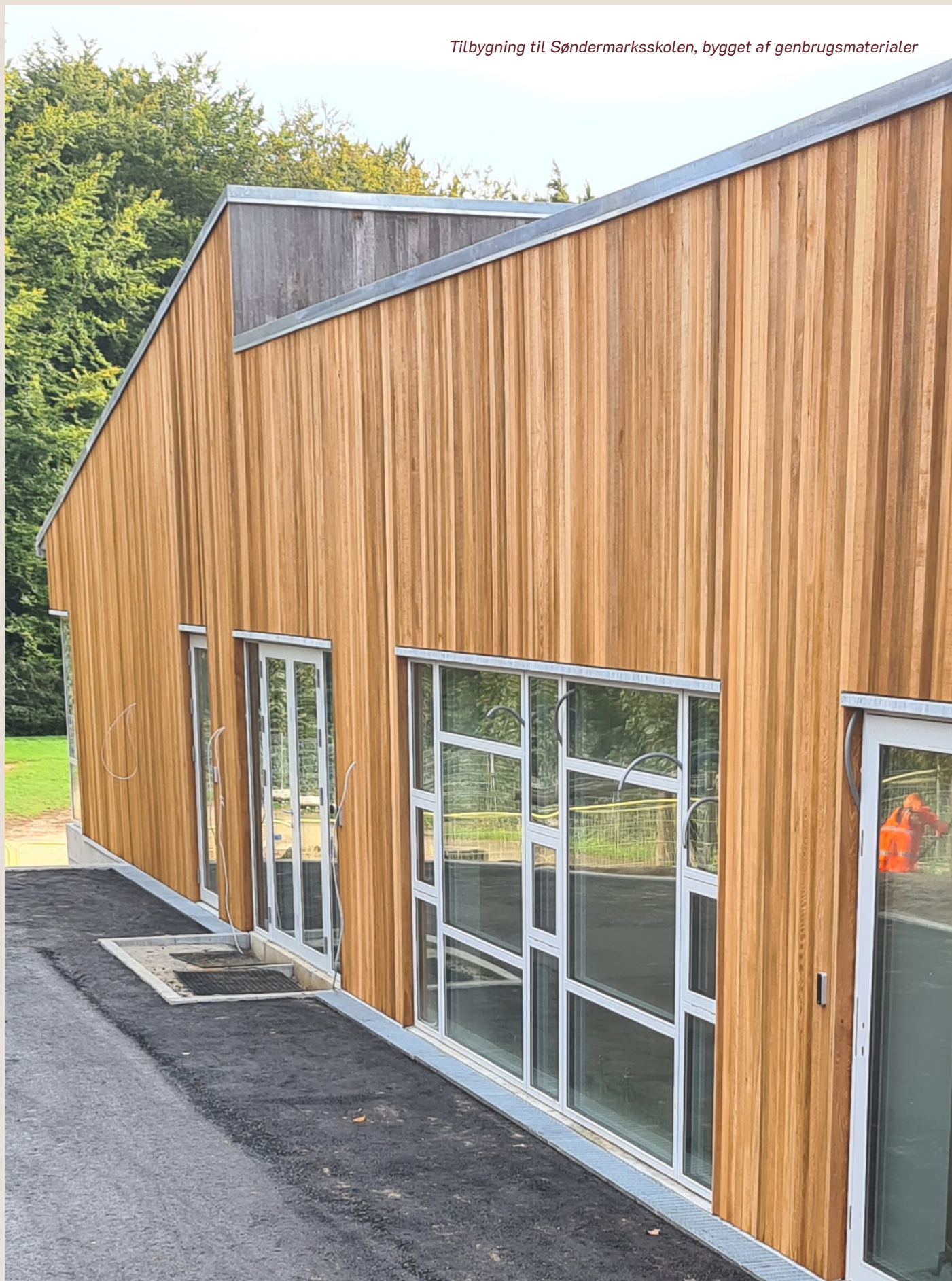
Tilbygning til Søndermarksskolen, bygget af genbrugsmaterialer