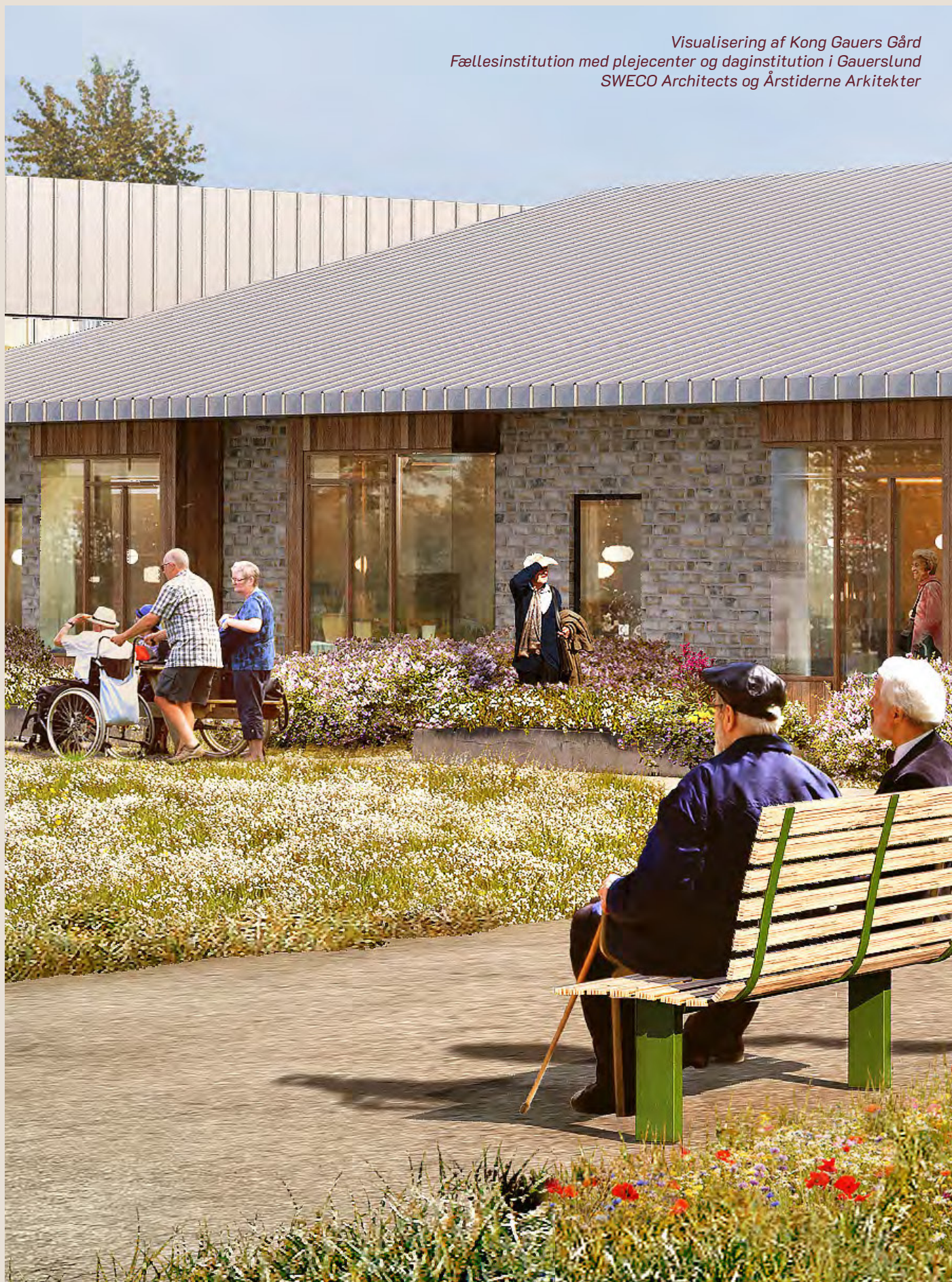
Visualisering af Kong Gauers Gård Fællesinstitution med plejecenter og daginstitution i Gauerslund SWECO Architects og Årstiderne Arkitekter