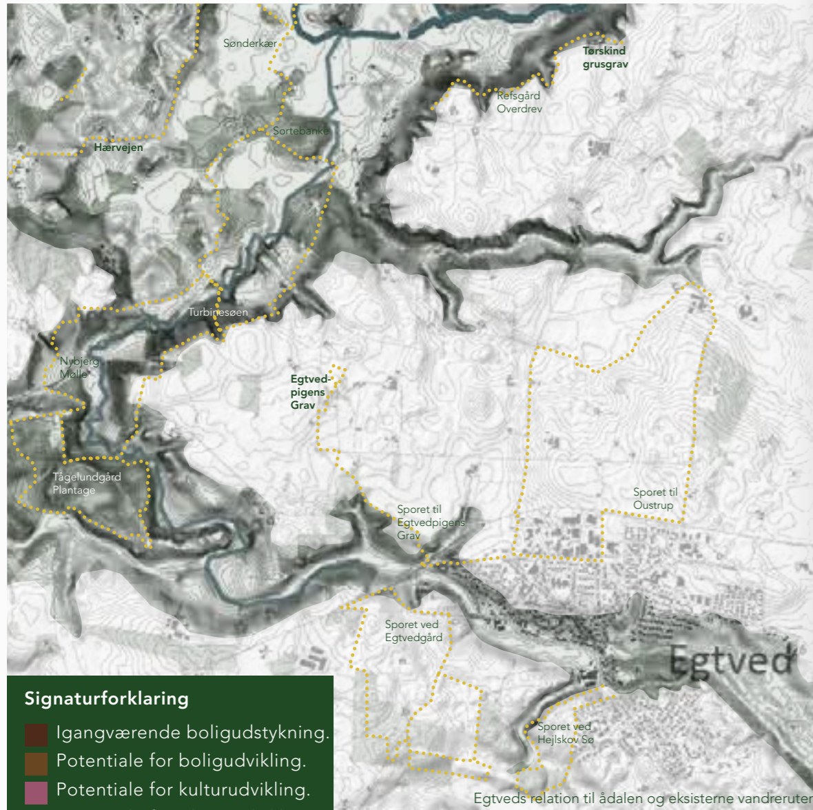
Egtveds relation til ådalen og eksisterende vandreruter