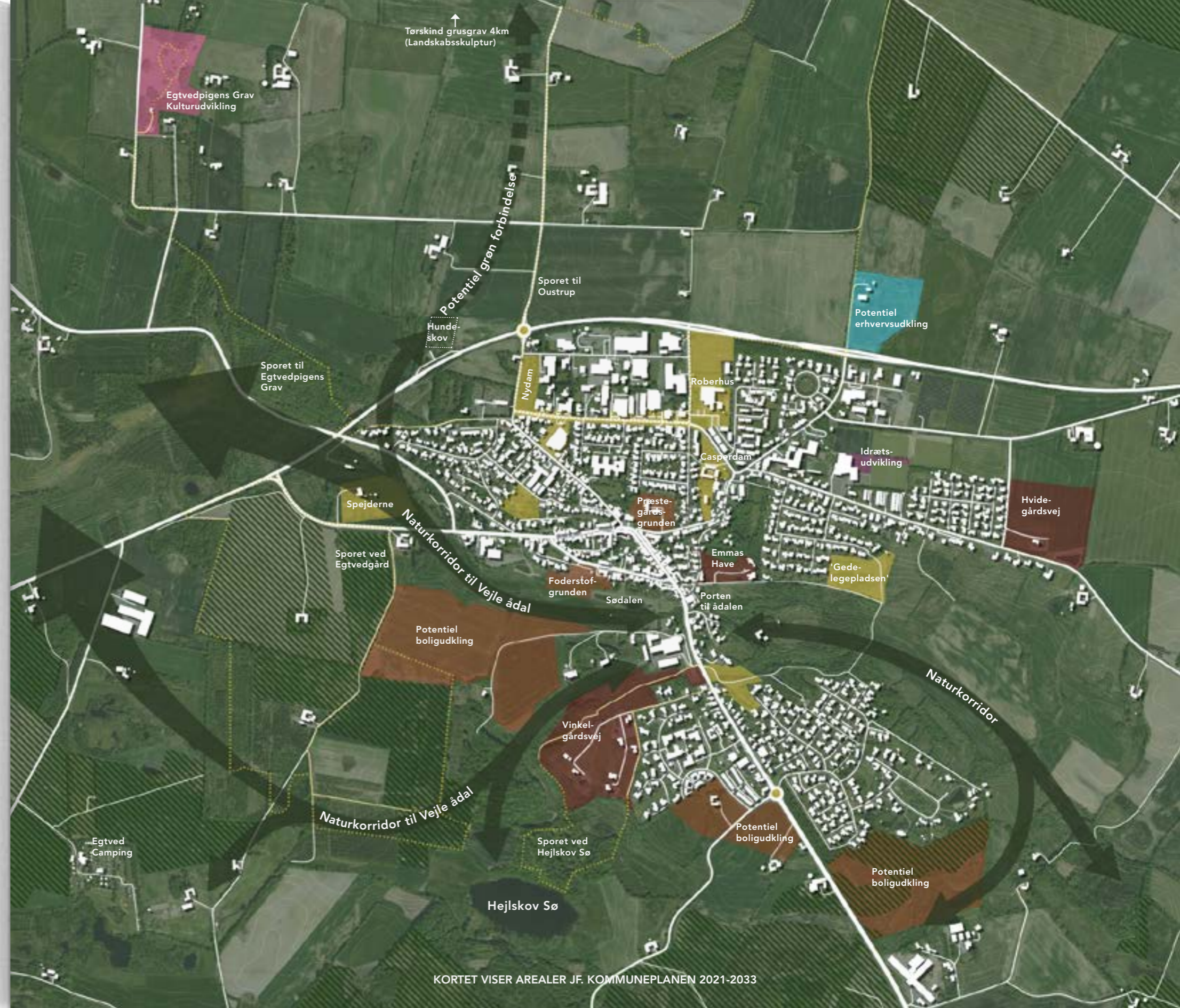
KORTET VISER AREALER JF. KOMMUNEPLANEN 2021-2033